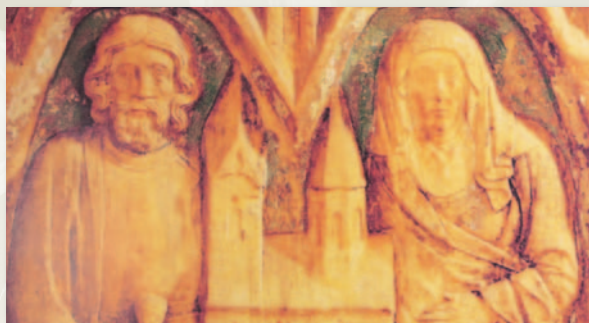
Graf Bernhard und Gräfin Christin von Engern und Ohsen, Stifter des Münsters St. Bonifatius zu Hameln

Sie stiften, wenn Sie nachhaltig und überlegt mit dem Stiftungszweck Ihr Herzanliegen unterstützen wollen. Sie können durch eine Zustiftung die Stiftung Hamelner Münster stärken.