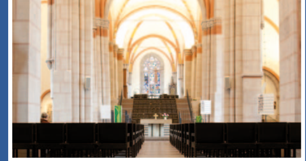
Erneuerung der Beschallung