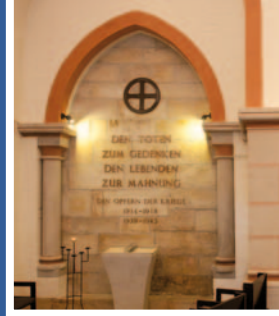
Erneuerung der Beleuchtung