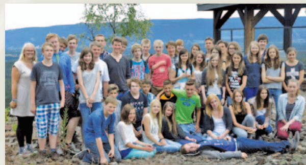
Unterstützung der Jugendaktivitäten