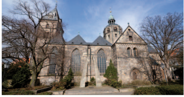
Münster St. Bonifatius